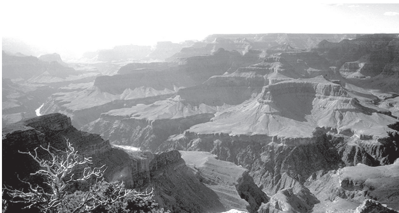
图 3.3 如果“路西法洪水”塑造了这一切，那么挪亚洪水又带来了什么？

网上的介绍还说：“在这颇具争议但见解独到的论证中，独特的解释迫使问题摊牌”。如果我们接受作者的说法，那么几千年来，创世记的读者显然对经文的真正含义一无所知。即使是伟大的圣经学者，如巴西流（Basil）、路德（Luther）、加尔文（Calvin）、约