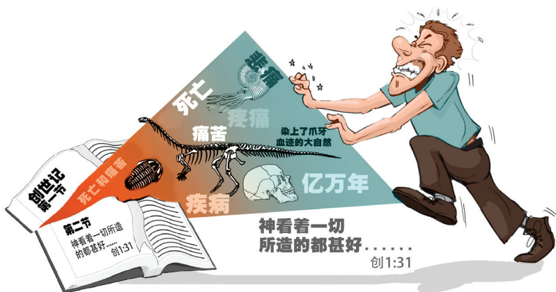
图 3.1 间隔论者常常不经意地把死亡和痛苦放在创世周和堕落之前。

语和动词从句，第二节包含三个“间接从句”，它们是描述或解释了第一节的情况。希伯来语法学家格塞尼乌斯（Gesenius）称其为“ vav explicativum ”，并将其与英语中的“to wit”相比较（类似于中文的“具体地讲”）。其他语法学家称其为变词（ vav copulative ）、串词变词（ vav disjunctive ）或解释变词（ explanatory vav ）。