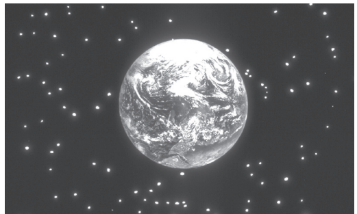
图 3.2 上帝在六日创造了万物 (出埃及记 20:8-11)