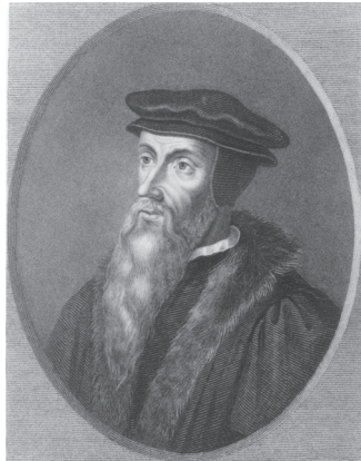
约翰·加尔文 (John Calvin)

认为福音或任何正典经文中包含虚假的断言，或经文作者说了不真实的话，都是不合法的，因为信仰就被剥夺了其基于圣经权威的确切性 18 。