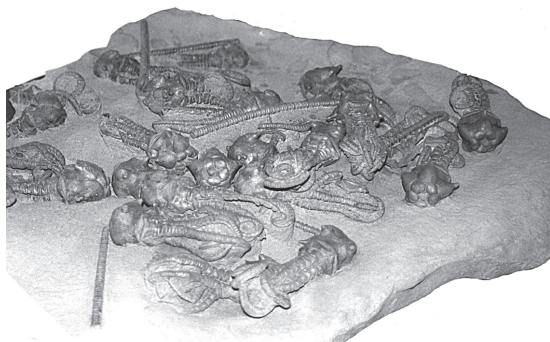
图 10.3 世界各地都有化石“墓地”，在那里许多动物的遗骸被水流冲积在一起，随后被埋葬并最终形成化石。这些现象被视为类似圣经中描述的大洪水等水灾事件的证据。

有大量证据表明，许多岩层是快速沉积形成的，层层叠加，中间没有明显的时间间隔。动物足迹、波纹痕迹甚至雨滴痕迹的保存状态，证明了这些特征是被快速覆盖，从而得以保存。跨层化石——即横跨多个地层的化石——表明地层的沉积速度非常快。地层之间缺乏风雨侵蚀、土壤形成、动物洞穴和植物根系的迹象，这也表明地层是快速连续沉积的。厚层沉积物的剧烈变形而没有开裂或融化的迹象，表明所有的地层在被弯曲时一定还非常软。砂岩堤坝（墙）和管道（圆柱）与下方许多层相同的材料相连，表明下方的层一定还非常软，