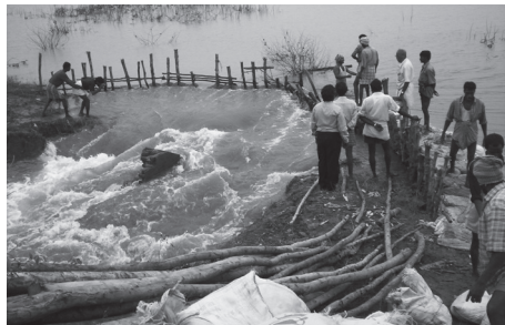
图 10.2 洪水进入印度钦奈（Chennai, India）的道路。如果挪亚时代的大洪水只是局部的，那么神应许“不再有洪水”意味着什么呢？

挪亚和他的家人在方舟上待了一年零10天（创世记7:11；8:14），对于任何局域的洪水来说，这个时间显得过长。七个多月后，山峰的顶端才露出水面。如果洪水仅是局部的，他们怎么可能在在这么长的时间里漂流而看不到任何山脉呢？