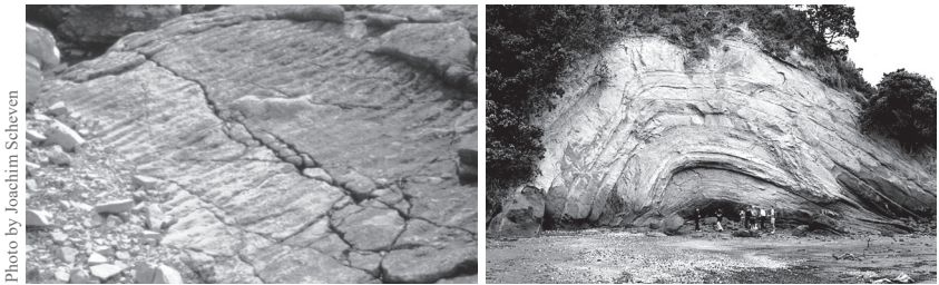
图 10.4 保存波纹痕迹（左）需要快速掩埋，正如英格兰早三叠世岩石所示，这种情况类似于大洪水中的情形。在没有开裂或加热的情况下弯曲的沉积岩层（右），例如在新西兰奥克兰的东部海滩，表明弯曲的褶皱形成于沙子和泥浆尚未硬化成石头之前，这一过程与大洪水期间的快速沉积相一致（可以参考人物与岩石的比例来感受岩石的规模）。

问题并不在于证据本身，而在于观察者的心态。一位地质学家曾表示，他从未见过任何大洪水的证据，直到他作为一名基督徒，从圣经中确信大洪水一定是一场全球性灾难。现在，他能够随处发现证据。圣经提到，人们背弃上帝后思想被腐蚀（罗马书 1:18 及以后），并在精神上变得如此盲目，以至于看不到显而易见的事物