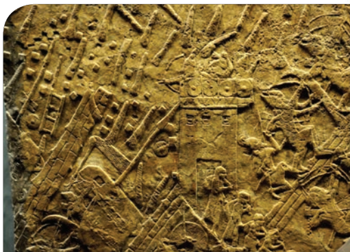
西拿基立将战役记载在浮雕与石碑中

除了浮雕之外，亚述王也把这件事记录在他的碑铭上。在亚述王朝的首都尼尼微，发现了一块纪念碑，上面记载着亚述王西拿基立间接承认他没有征服耶路撒冷，并最终不得不撤退。碑文写道：